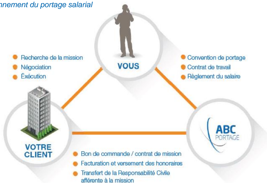
Schéma du fonctionnement du portage salarial

Le porté bénéficie du statut de salarié et par conséquent de tous les avantages qui lui sont liés : retraite, maladie, prévoyance, vieillesse, chômage, formation, etc., en comparaison à d'autres statuts qui n'apportent pas cette sécurité et autant de prestations sociales.